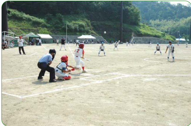
稲木川杯ソフトボール大会の女子の試合

高学年男子の部 優勝：高屋 準優勝：県主タイヨーズA 3位：稲倉A、高屋K 低学年男子の部 優勝：高屋Y 準優勝：大江A 女子の部 優勝：木之子慎思女子 準優勝：荏原スポーツ少年団