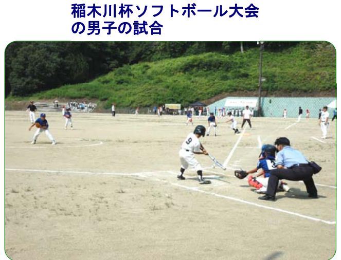
稲木川杯ソフトボール大会の男子の試合