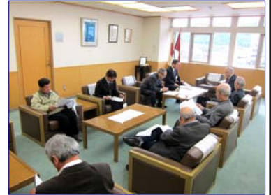
要望書提出後お互い に意見交換