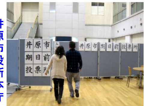
井原市役所1階の期日前投票所。