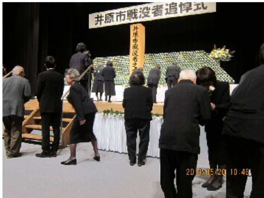
遺族ら参加者全員が献花