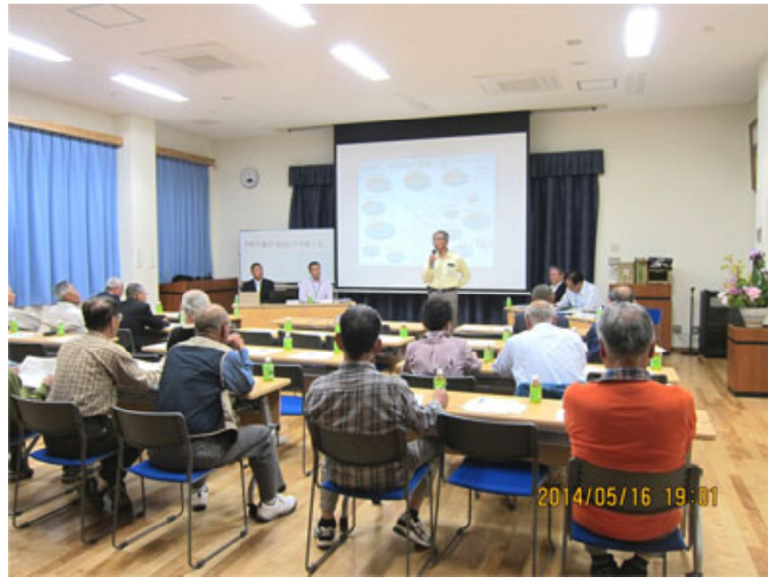
大江地区の「市民の声を聴く会」