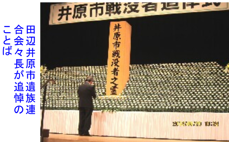
田辺井原市遺族連合会々長が追悼のことは

* 井原地区は出部地区を含む * 当日参加者320名、来賓48名、執行委員11名、係員23名