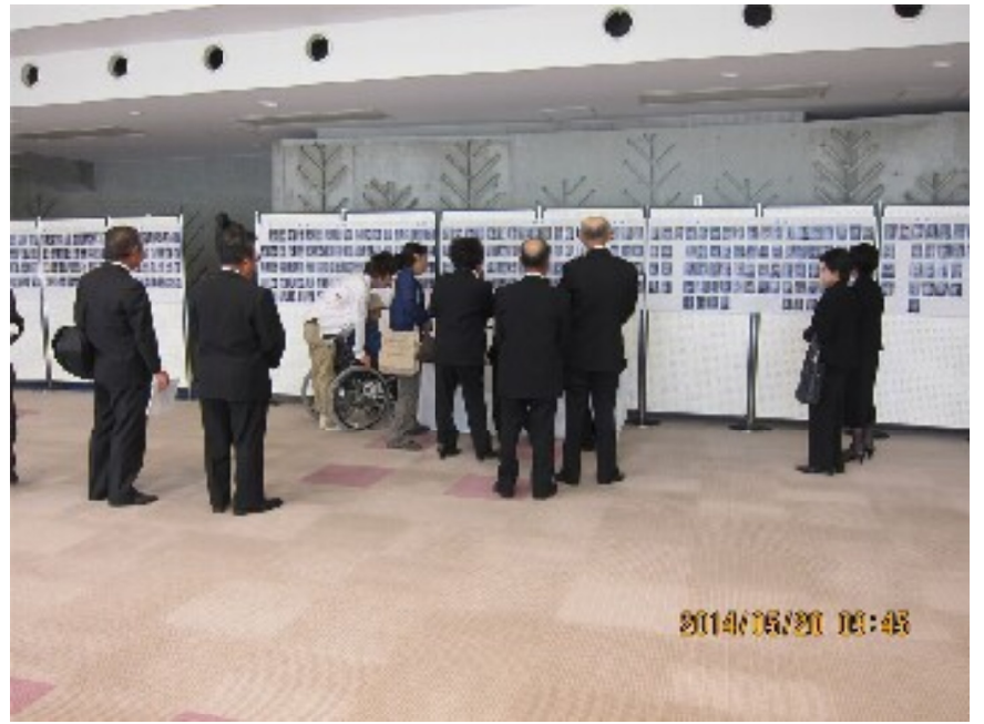
ホワイエに戦没者の写真を掲示