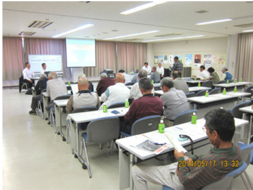
芳井地区の「市民の声を聴く会」