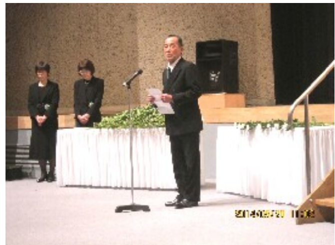
遺族を代表し森原井原市遺族連合会副会長が謝辞

読者ニュース「きずな」に対するご意見や情報をしんぶん赤旗の配達・集金者にどしどしお寄せください。