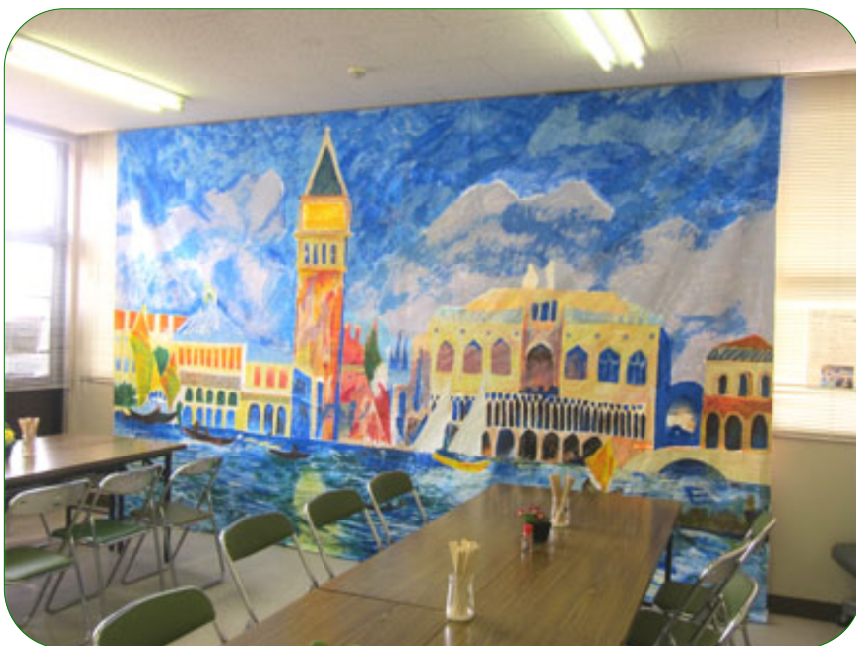
木之子中学校美術部共同制作の「ヴェネチア ドゥッケーレ宮殿」(この絵の大きさは縦4m横4.86m) 原画はルノワール制作の油絵