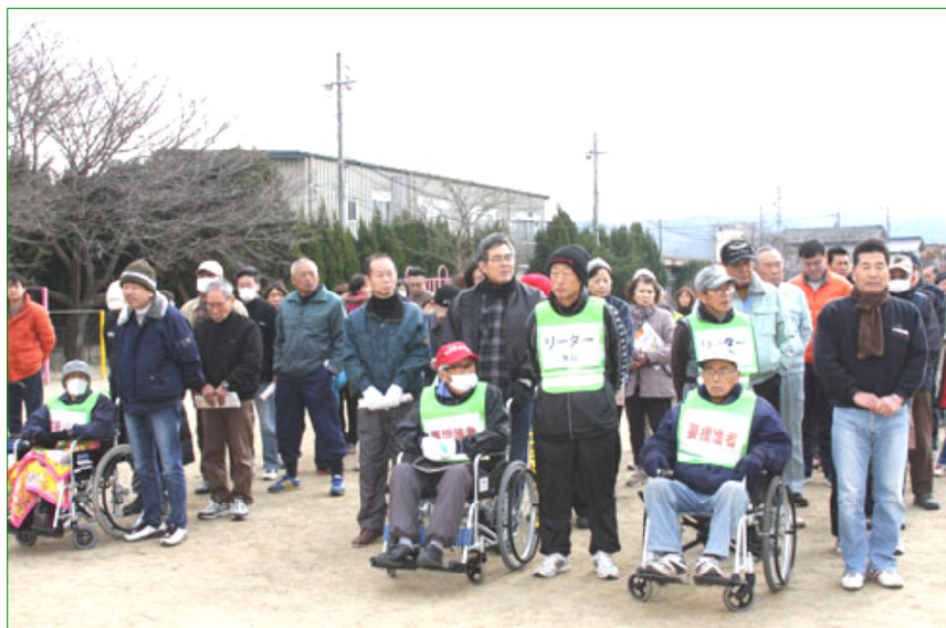
主催者の説明を聞く各班から笹井公園に避難してきた笹井地区の方々