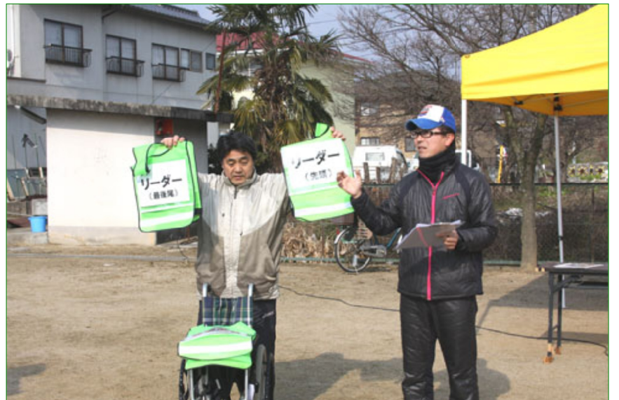
笹井公園に集まって来た避難者に説明する避難訓練の指導者