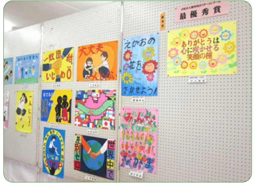
人権啓発ポスター優秀賞作品等