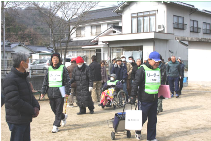
1班から3班に集まっていた避難者が、そくそく全体の避難場所へ集まってきました。