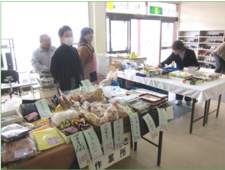
福祉施設の模擬店