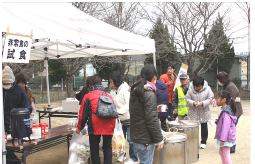
非常食のカレーライスを試食する参加者