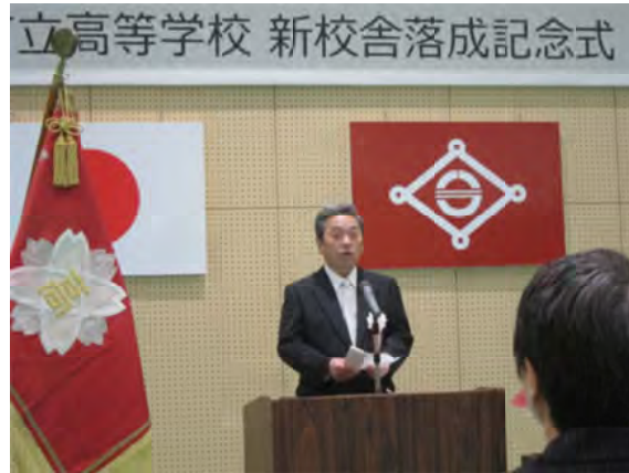
式典で式辞を述べる瀧本市長