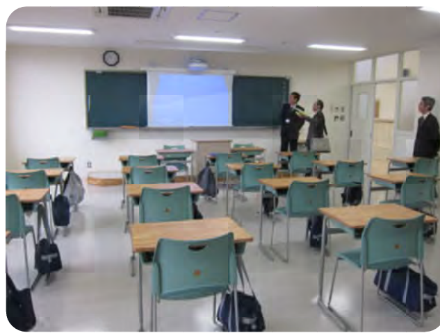
教室(1年～4年生までの4教室あり)