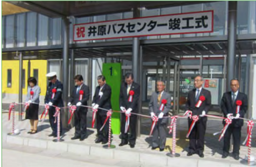
竣工式後関係者がテープカット

3月30日に井原バスセンターの竣工式が、4月10日に井原市立高等学校新校舎落成記念式典が行われました。バスセンターの施設と新校舎の施設を写真で紹介します。