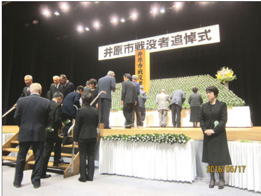
遺族ら参加者全員が献花