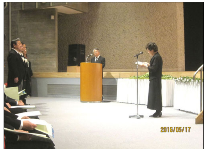
遺族を代表し熊原井原市遺族連合会女性部長(右)が謝辞

読者ニュース「きずな」に対するご意見や情報をしんぶん赤旗の配達・集金者にどしどしお寄せください。