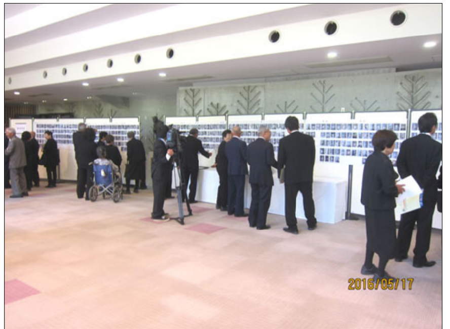
ホワイエに戦没者の写真を掲示