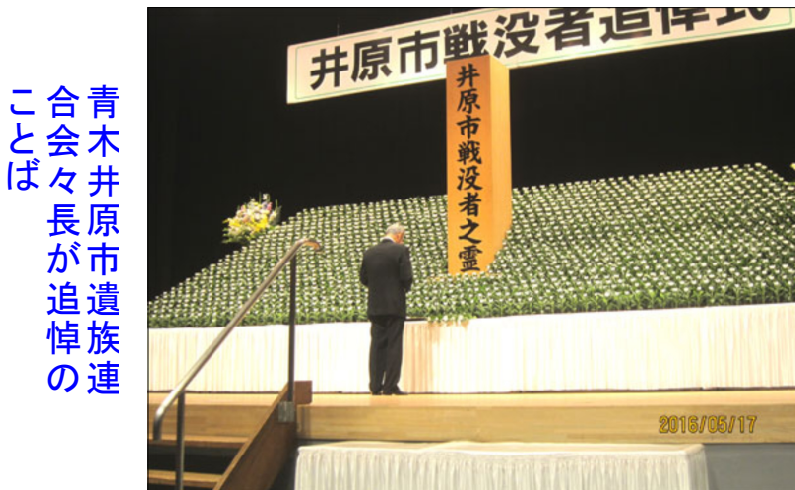
青木井原市遺族連合会々長が追悼のことは