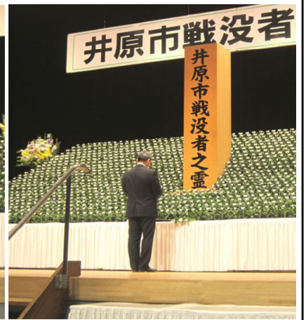
上野議長が追悼のことは